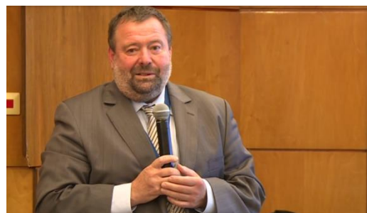
Az OAH főigazgatója lezárja a 2016.10.04-i közmeghallgatást.