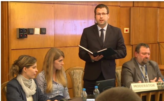
A szabályok ismertetése a 2016.10.04-i közmeghallgatáson.